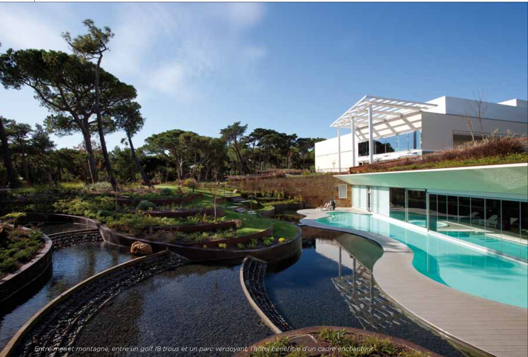
Entre mer et montagne, entre un golf 18 trous et un parc verdoyant, l'hôtel bénéficie d'un cadre enchanteur.

dont 68 chambres de luxe et 4 suites, ainsi que 12 villas spacieuses construites près du pavillon de chasse jadis fréquenté par le roi Carlos du Portugal lors de ses expéditions dans la montagne voisine. Soulignées de pierre et de verre, les façades du bâtiment principal arborent les tonalités de la terre et se fondent merveilleusement dans ce magnifique parc peuplé de pins soigneusement aménagé par l'architecte paysagiste Francisco Caldeira Cabral. Dans le lobby, majestueux, et comme partout dans l'hôtel, le blanc brille par sa présence et confère aux espaces une élégante sobriété, tout juste réchauffée par les tonalités or